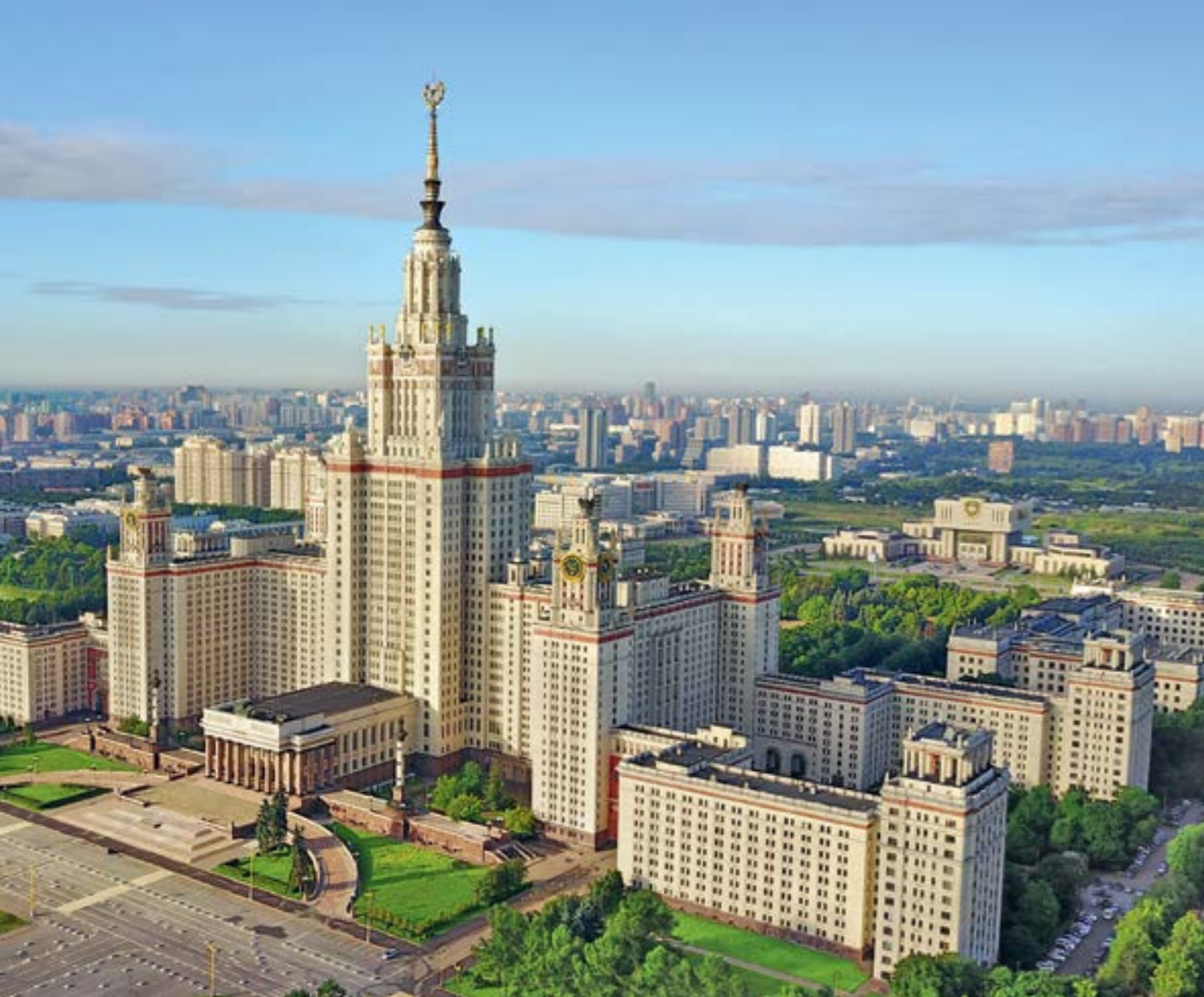
Московский государственный университет имени М.В. Ломоносова