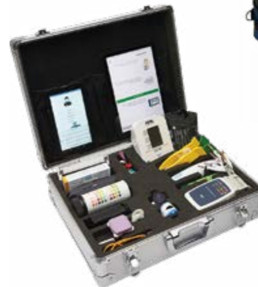
Мобильный диагностический кейс №1