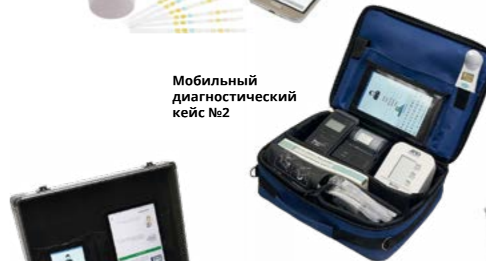
Мобильный диагностический кейс №2