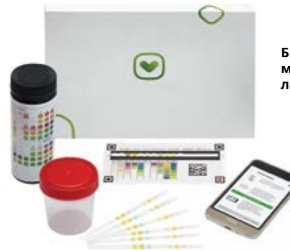
Биохимическая мобильная лаборатория

Мобильный диагностический кейс №2 , предназначенный для прохождения предсменных и предрейсовых осмотров .