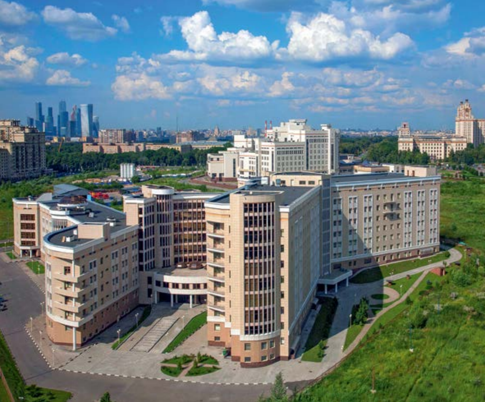
Медицинский научно-образовательный центр МГУ имени М.В. Ломоносова (МНОЦ МГУ)